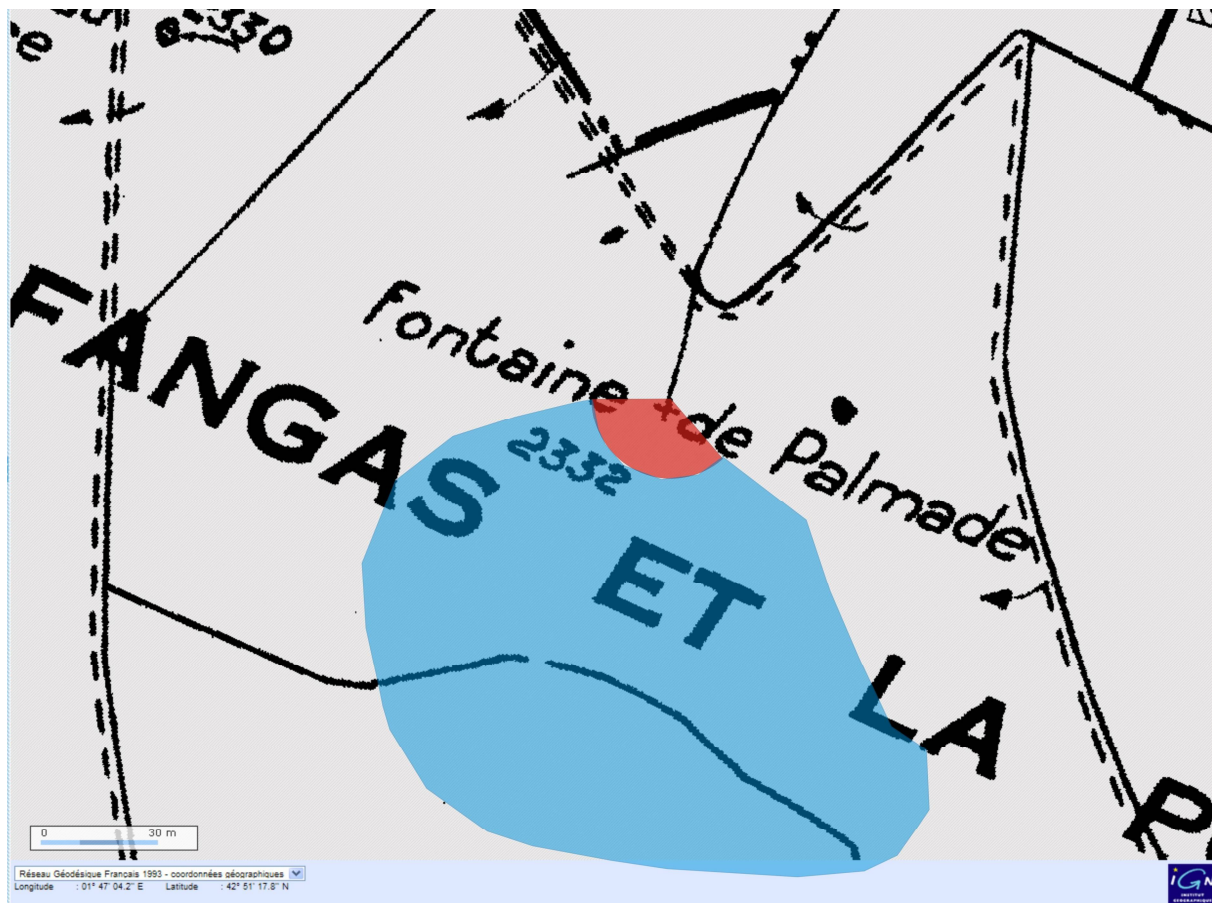
Figure 7 : Périmètre de Protection Rapproché proposé, sur fond cadastral