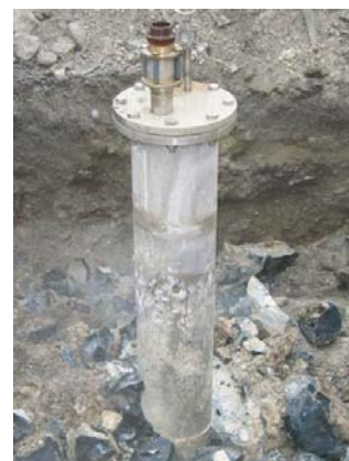
Figure 8l : Dégagement du tubage du forage