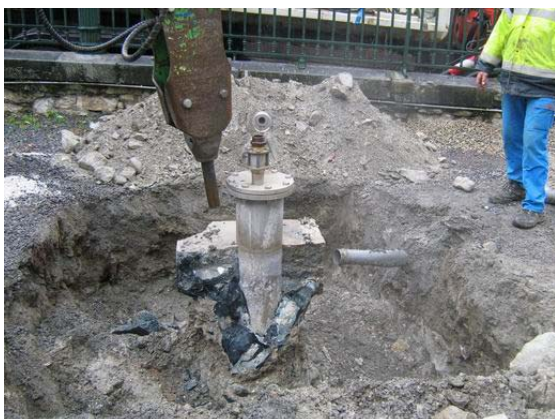
Figure 8k : Enlèvement de la cimentation par brise roche