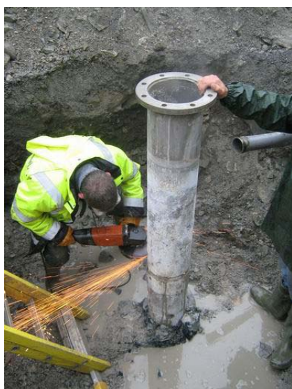
Figure 8m : Découpe du tubage