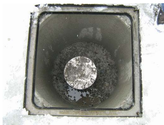
Figure 8p : Vue du forage dans le regard