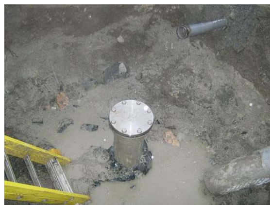
Figure 8n : Pose de la bride pleine