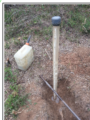
TM1 - I1