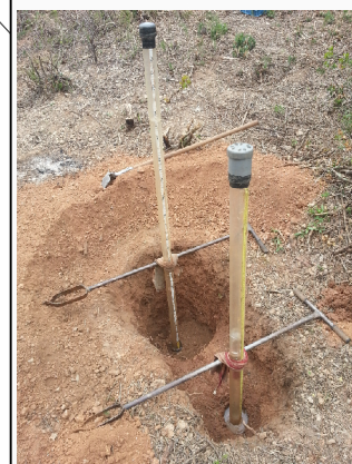
TM2 - I2a.b