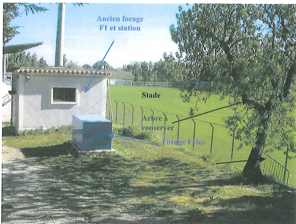
Figure 1 : Photo du site

En conséquence, le forage F1bis étant un forage vertical avec un espace annulaire du tubage constituant la chambre de pompage totalement cimenté jusqu'à 33 m, l'extension du périmètre de protection immédiate peut être très limitée. Afin de tenir compte des conditions spécifiques de ce site, les limites du périmètre de protection immédiate sont proposées de la manière suivante :