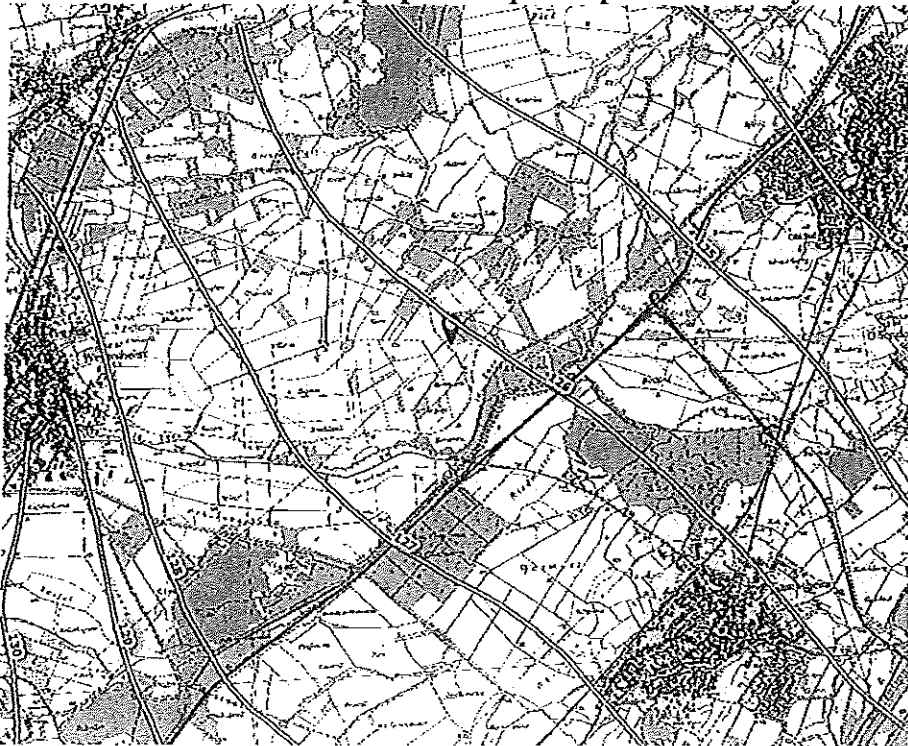
Carte 2 : niveau de la nappe phréatique en période de moyennes eaux.