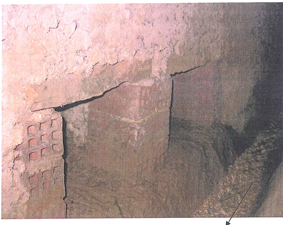
Barbacanes à l'entrée de la galerie drainante