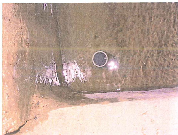
Détail du trop-plein PVC