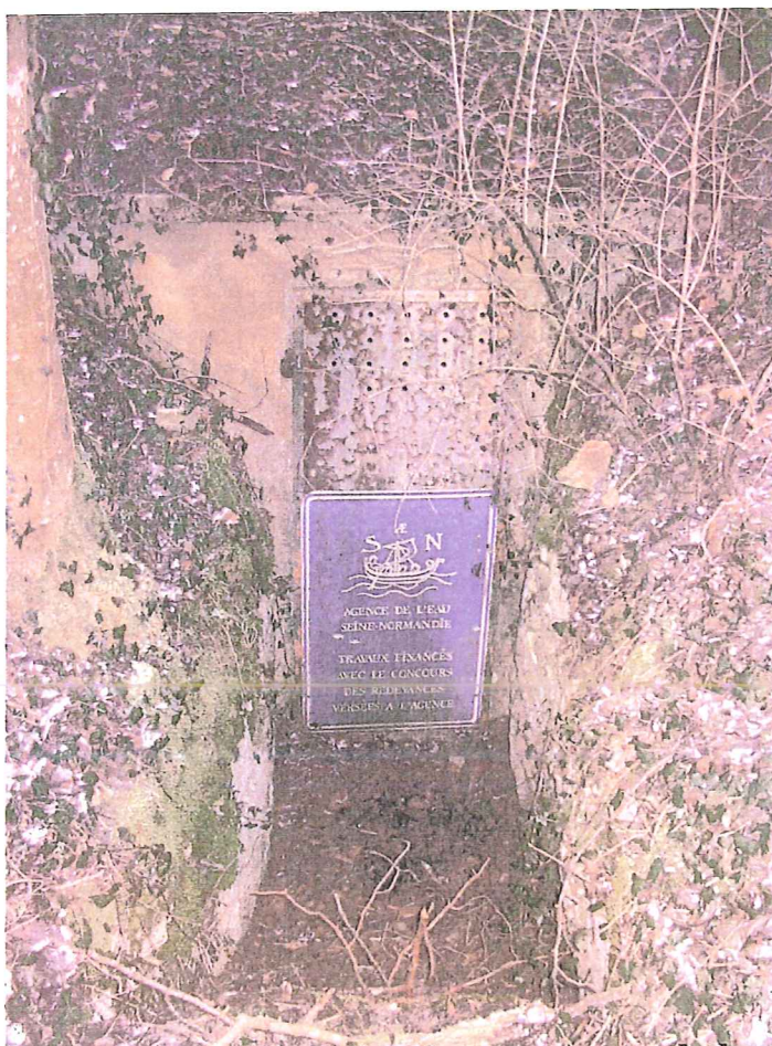
Escalier et porte d'accès au captage de la source des Magées