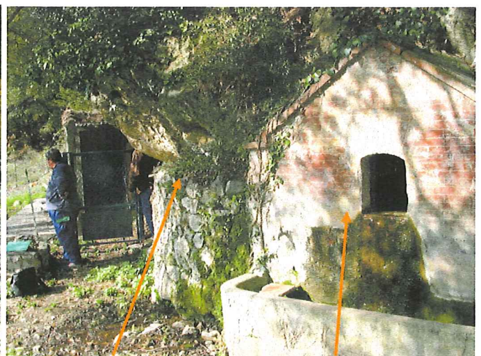
Rigole venant de source haute ; Fontaine