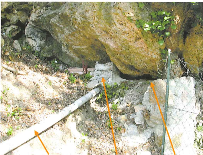
Tuyau vers bassin ; Captage source haute ; Rigole