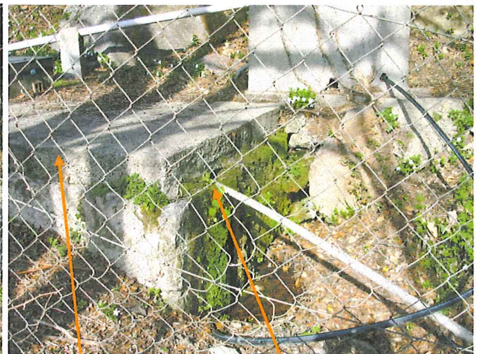
Bassin (source basse) ; Trop plein