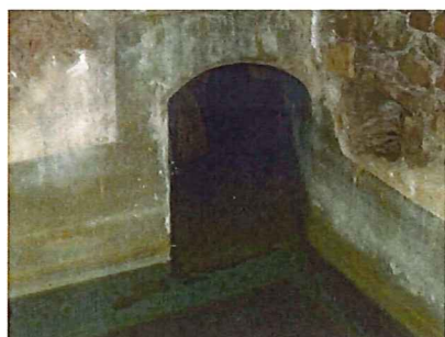
Galerie d'arrivée d'eau