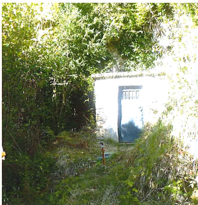
Vue extérieure du captage