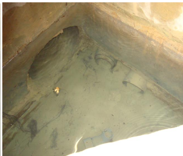
trois arrivées d'eau