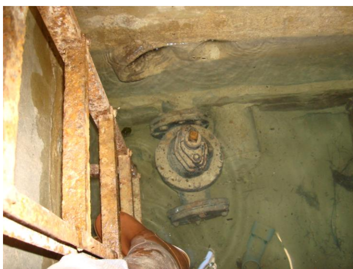
départ vers distribution et autres conduites