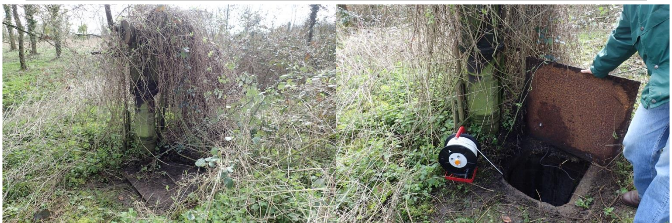
Repère : Rebord du puits