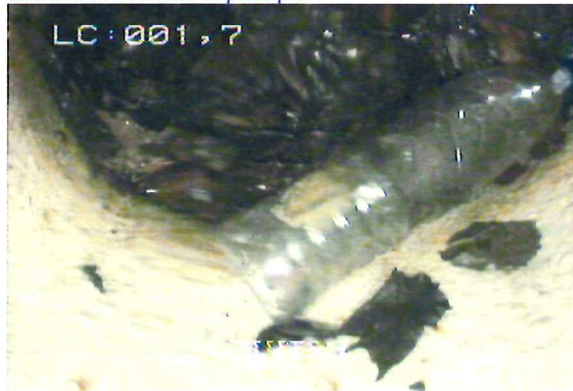
A 2,2m : Niveau statique de la nappe d'eau avec un tas de feuilles brunes et une bouteille en plastique.