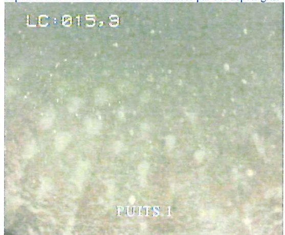
15,9m : La paroi du tubage est recouverte d'une couche de dépôts bruns. Les ouvertures sont colmatées par des dépôts gris.