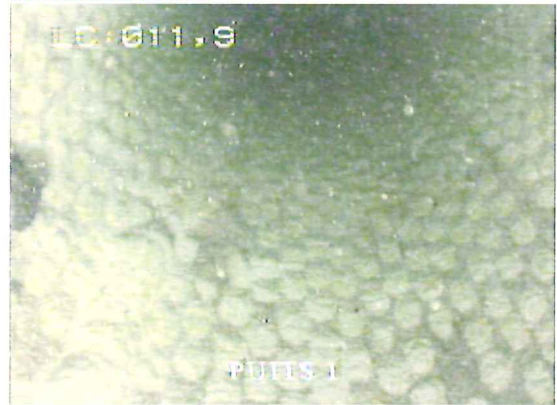
11,9m : Les ouvertures sont recouvertes d'épais dépôts gris et sont colmatées à 100%.