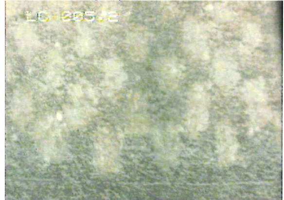
5,2 m : Début du tubage crépiné.