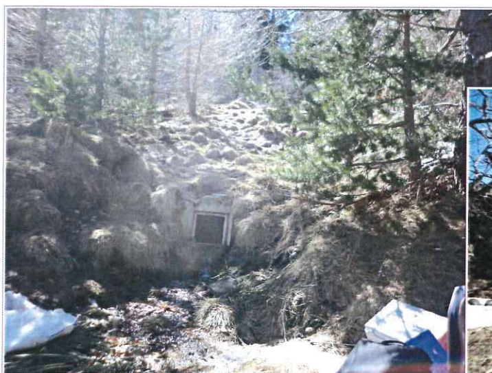
Le captage de Gare Vella vu de l'aval vers l'amont