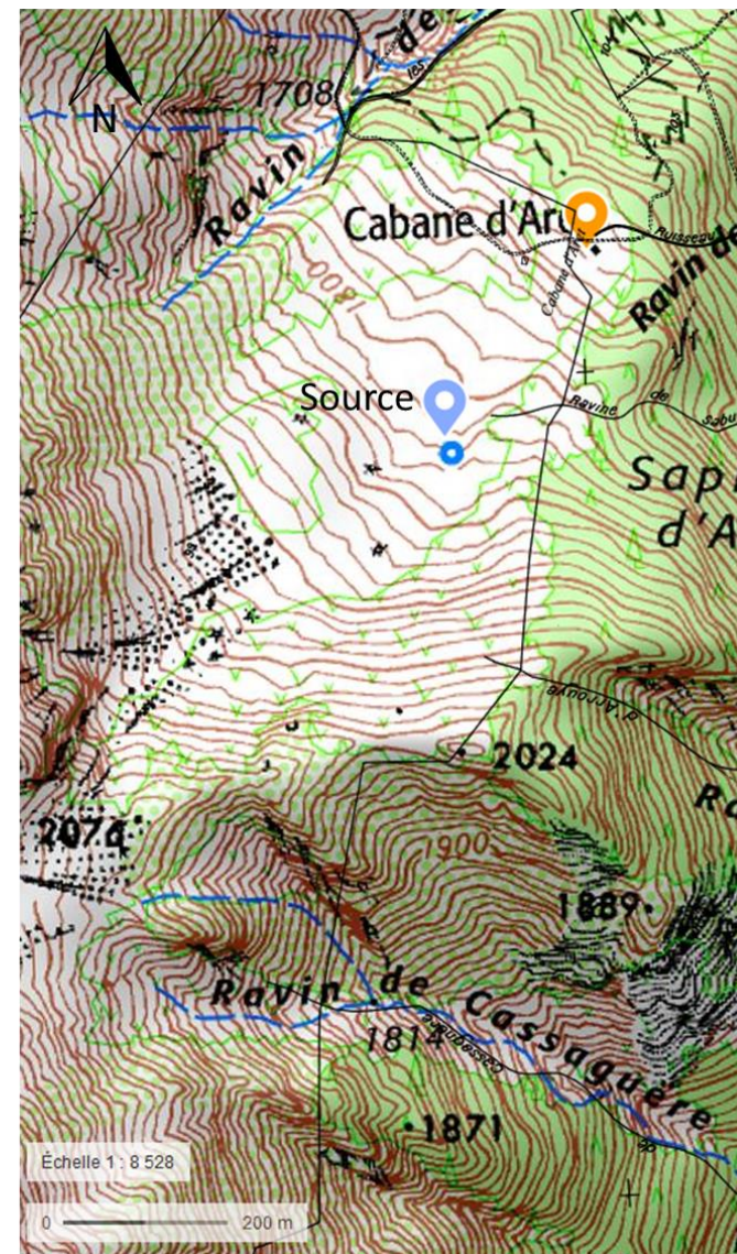
Figure 1 : Situation générale de la source d'Aret en a et avec situation de la parcelle cadastrale en b