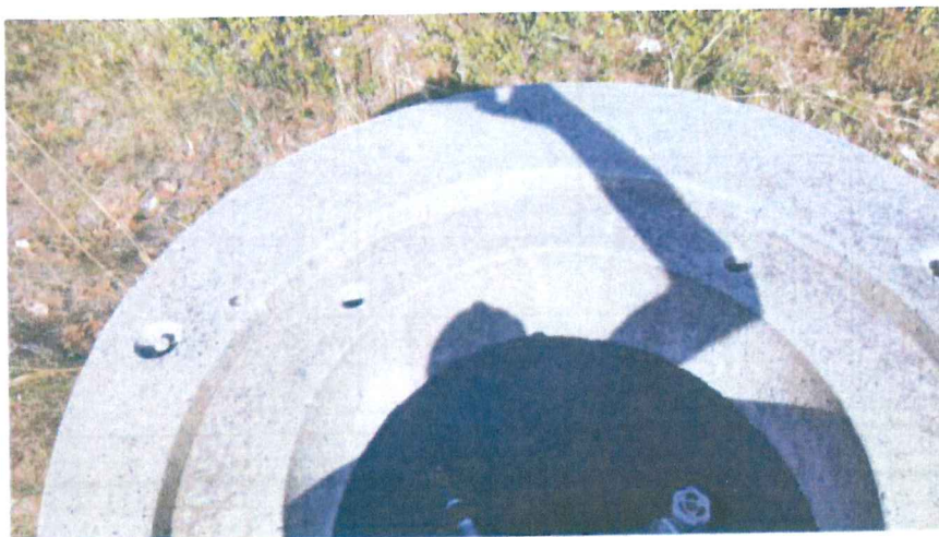
Absence de dalle et de capot de visite