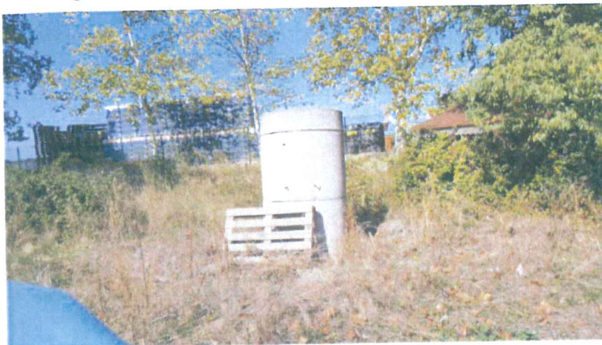
Protection sommaire de la tête de forage

Le forage P. Forage Domaine de la Baume se situe dans l'enceinte non clôturée du Domaine de la Baume. Il est logé à l'intérieur de plusieurs buses DN1000 mm empilées sur 2,3 m/TN, non maçonnées et peu stable. La tête de forage dispose d'une bride et d'une contre bride non étanche à 1,5 m/TN. Elle est équipée d'un robinet de prélèvement et du départ en distribution par une conduite en PEHD DN40 mm vers les installations du Domaine. Lors de ma visite de terrain, j'ai noté l'absence de dalle béton radier de l'ouvrage, l'absence de dalle de couverture et d'échelles d'accès à l'ouvrage.