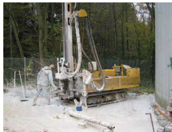
Foration et pompage de développement du piézomètre