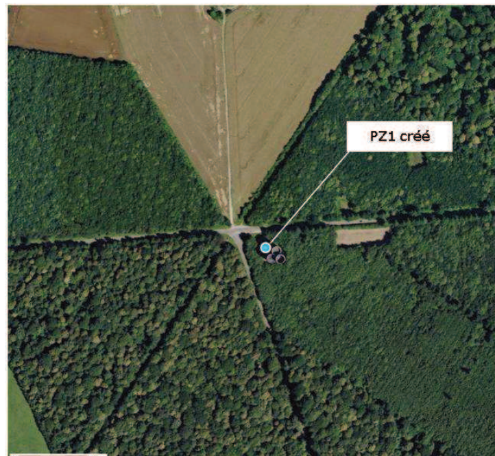
Figure 2-3 : Situation du piézomètre PZ1

Le piézomètre PZ1 est implanté sur la parcelle D330, aux pieds du réservoir d'eau potable de la Ventelette (CREA). Les travaux de foration ont été réalisés par l'entreprise SETRAFOR, du 17/11/2014 au 21/11/2014.