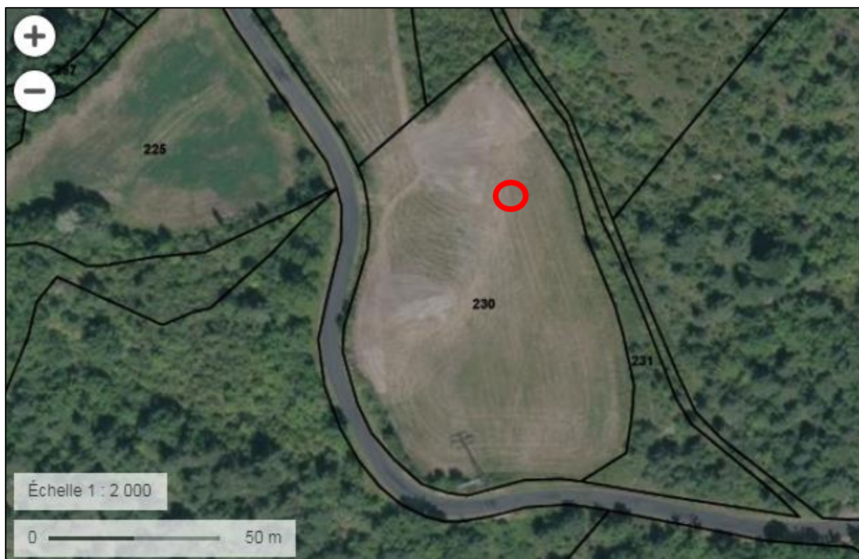
Figure 3 : Localisation du projet sur ortho-photo et plan parcellaire (source Géoportail)