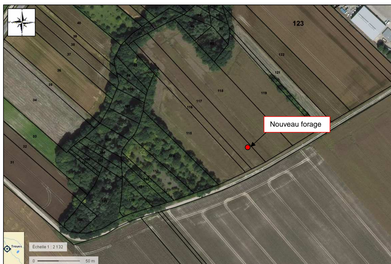
Figure 3 : Localisation du nouveau forage sur vue aérienne