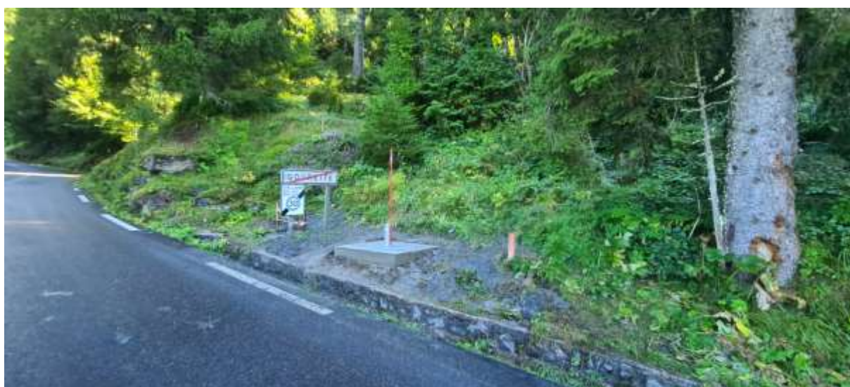
Protection de tête du PZ1 : capot hors sol galvanisé et cadenassé, avec dalle de 2 m 2