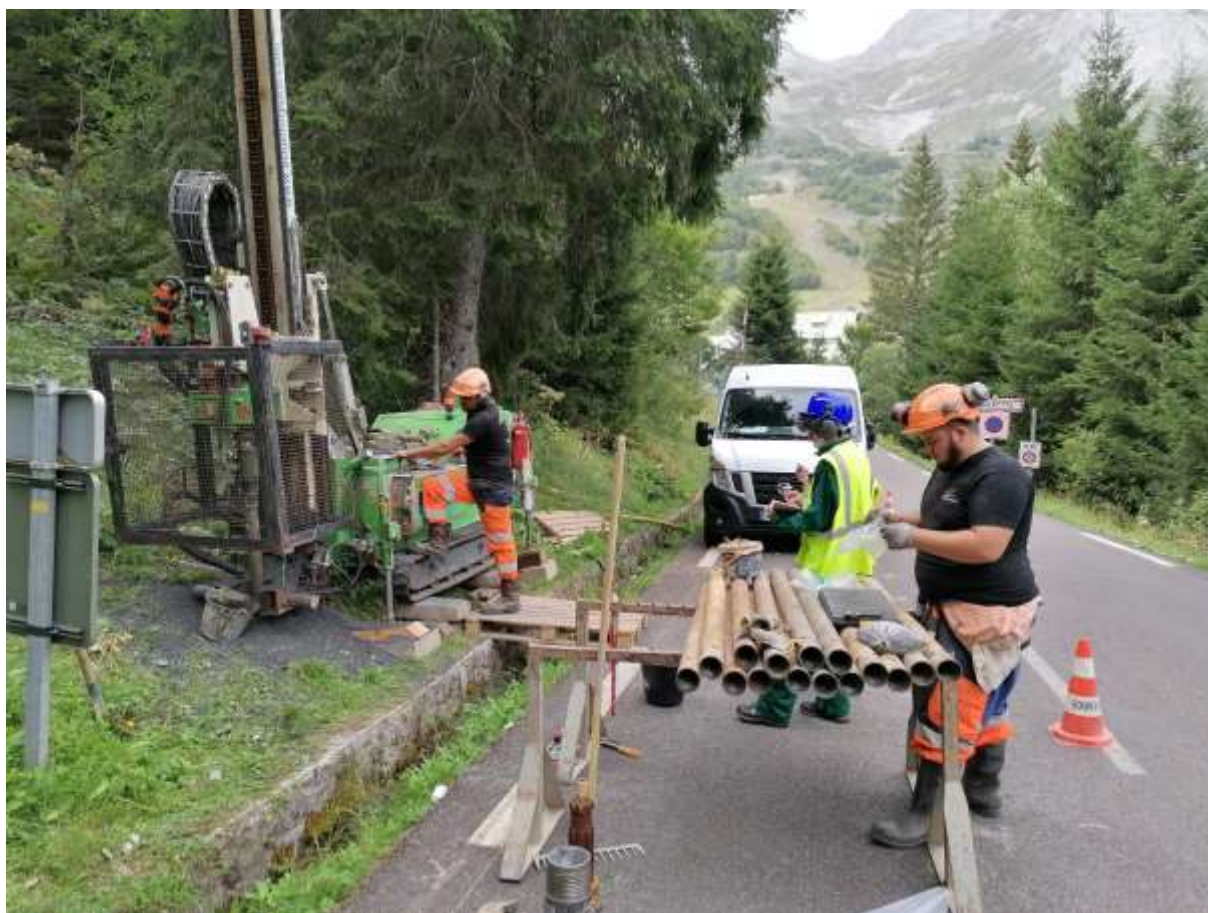
Foration du PZ1