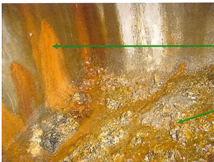
Captage latéral, vue intérieure