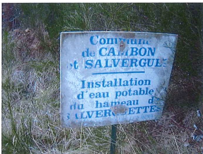
Zone de captage principale