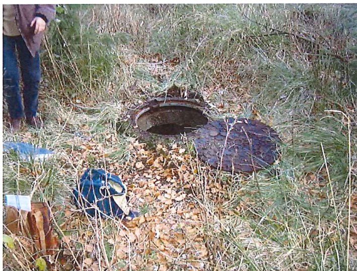
Captage latéral, vue extérieure