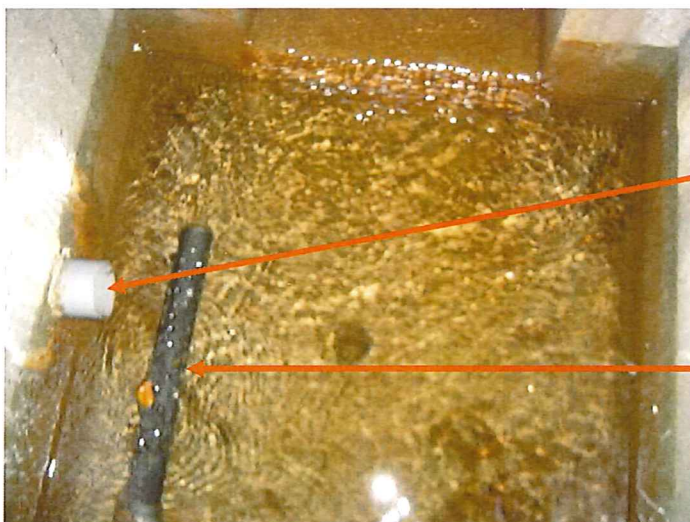
Ouvrage de prise d'eau, vue intérieure