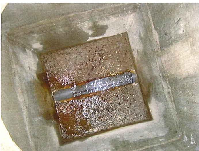
Intérieur du regard intermédiaire