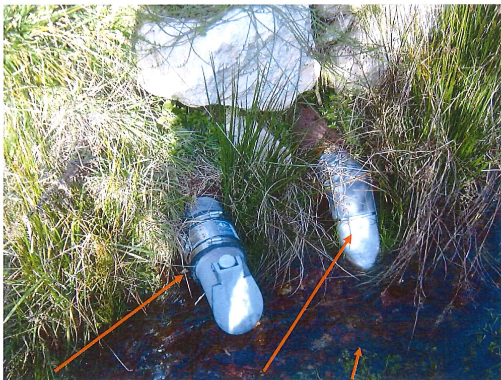
Exutoire trop plein et canalisation d'adduction. Ruisseau