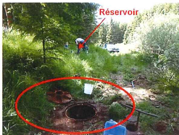
Vue extérieure