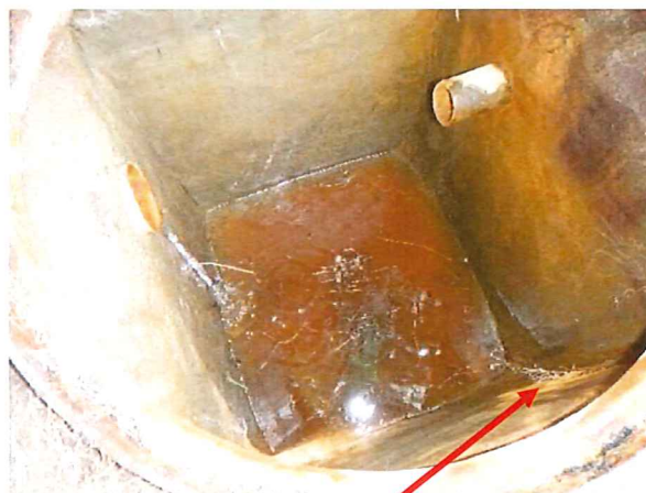
Vue intérieure Racines