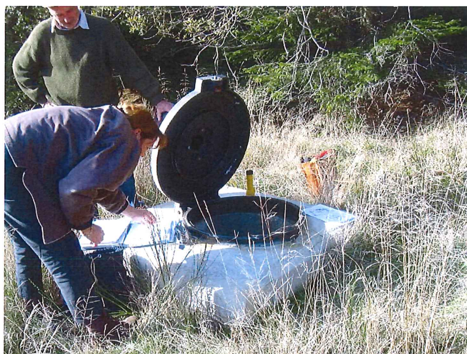
Regard du captage