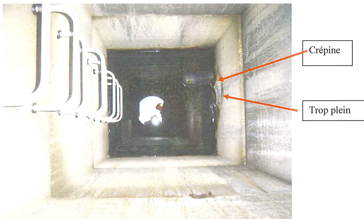
Intérieur du puits