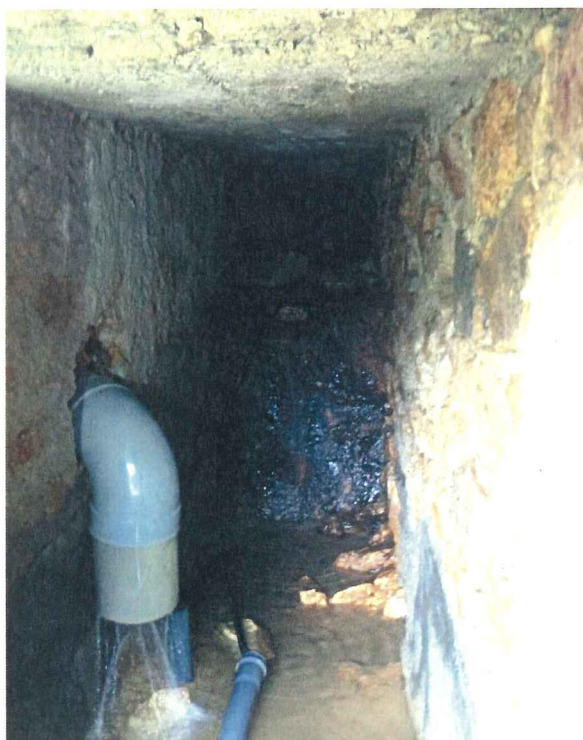
Bac de collecte – Arrivée 2 – Ressaut de la galerie