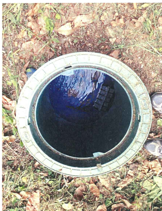
Regard avant réservoir affleurant la surface du sol