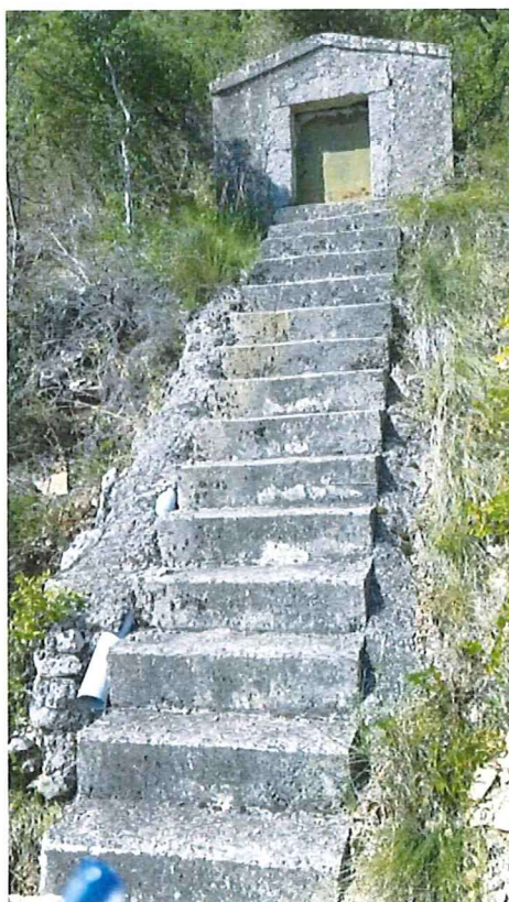
Vue d'ensemble Photos Otéis