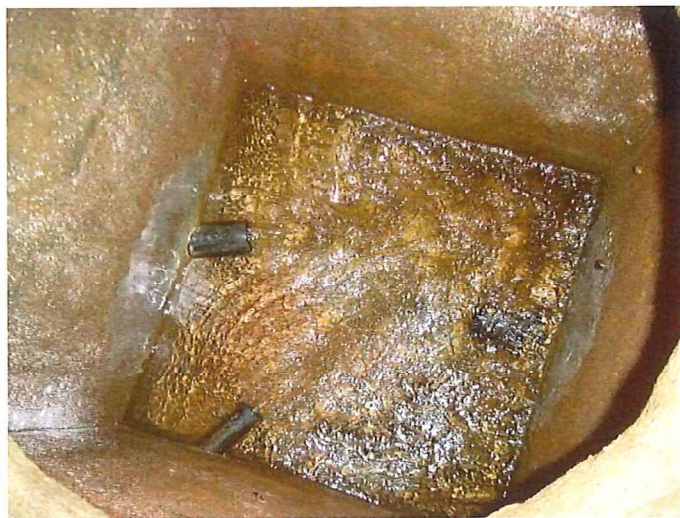
Intérieur de l'ouvrage. En bas : arrivée de Murène A gauche : arrivée de Font Estrémière/Nouguier A droite : départ vers le brise-charge