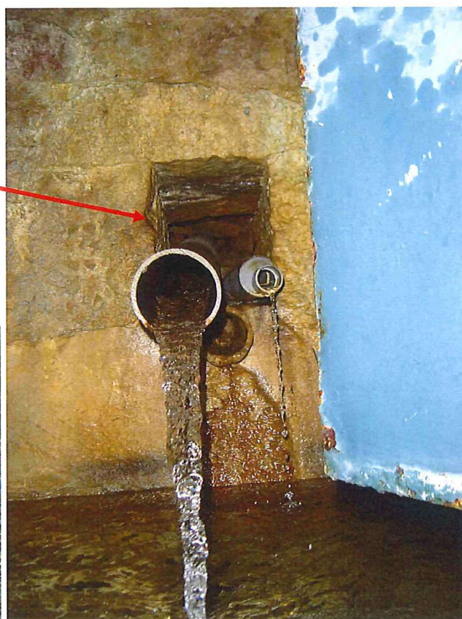
Intérieure de l'ouvrage