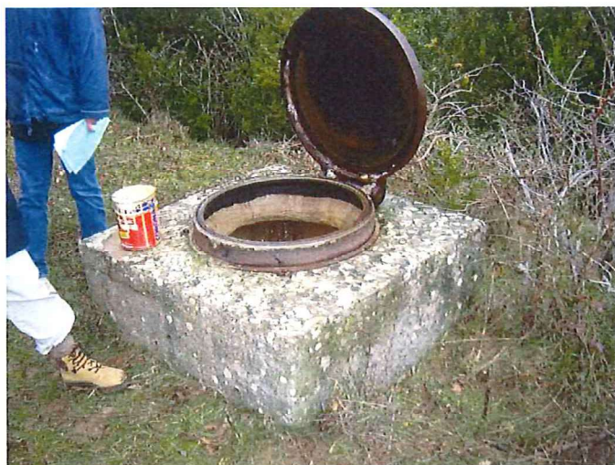
Extérieur de l'ouvrage