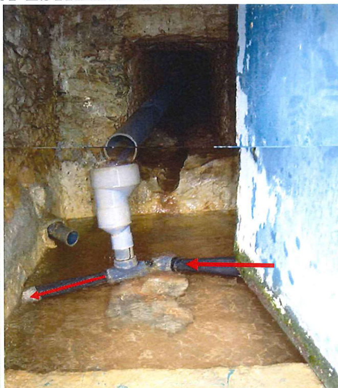
Intérieur de l'ouvrage