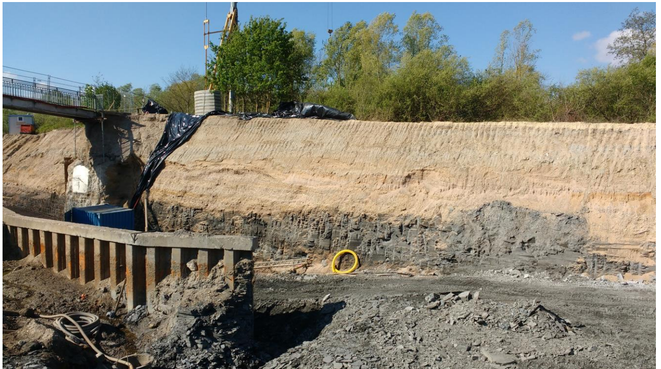
Fig. 2 Superposition des marnes liasiques grises en bas, et des alluvions quaternaires beiges en haut.