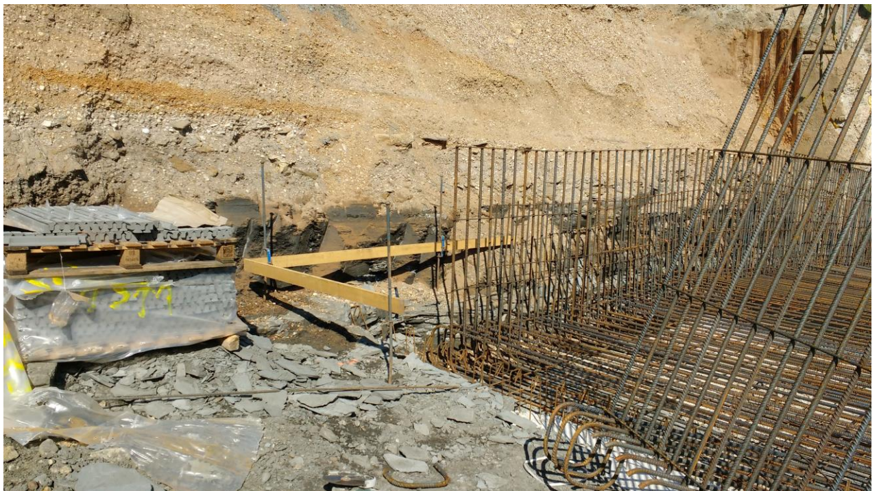
Fig. 3 détail des alluvions conglomératiques et le débit en plaquettes des marnes grises après séchage.

L'âge des marnes dépourvues de macrofossiles n'a pas été évalué. L'intérêt principal de cette modeste note est que l'on pouvait mesurer à cet endroit l'épaisseur des alluvions de la Meurthe qui atteignent environ 5 m.