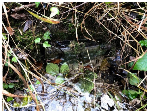
Figure 5 : Vues extérieures du captage