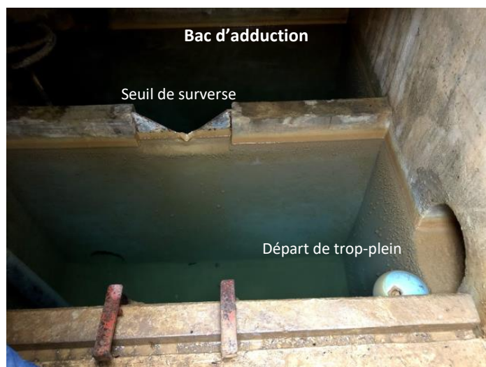
Figure 4 : Vues intérieures du captage

Le captage est recouvert d'une dalle béton et d'un capot en fonte de type « Foug » verrouillable et équipé d'une cheminée d'aération.