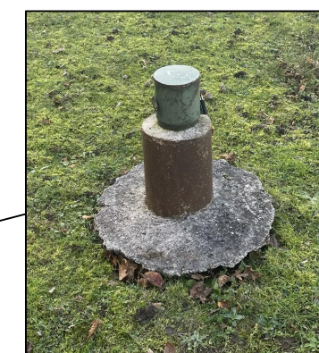
Piezomètre 1 Haut du piézomètre Z : 123.72 Bas du piézomètre Z : 123.35