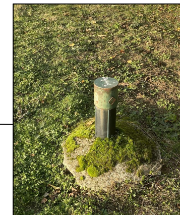
Piezomètre 3 Haut du piézomètre Z : 123.02 Bas du piézomètre Z : 122.70