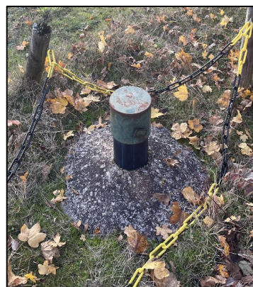
Piezomètre 2 Haut du piézomètre Z : 123.20 Bas du piézomètre Z : 122.85

Cadastre Section YK n° 97 Lieu-dit : LES PEROUX